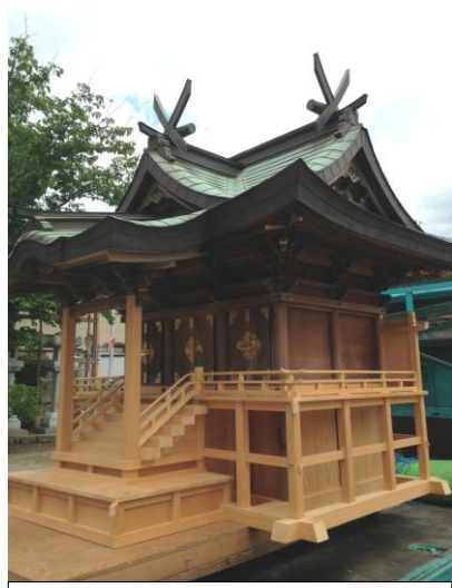
鳥海神社に奉納した社殿 (和歌山・藤井寺社建築工業提供)

あれから三年。順調に復興へと向っている地域もあれば、そうでない地域もあり、今もなお仮設住宅で不自由な生活をされている方々もいらつしやいます。地域の中心であり心のよりどころであるべき氏神神社も同様、手付かずの神社も多く残ります。